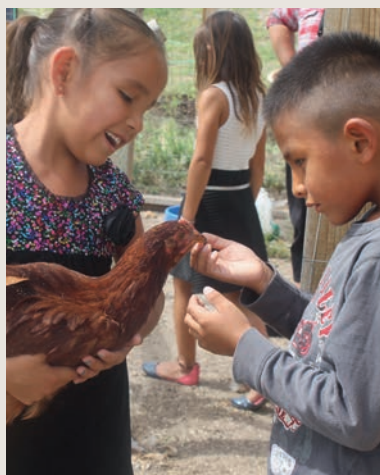
Die Schüler versorgen die Hühner